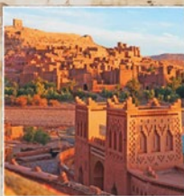
Marocco da € 540