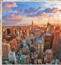
New York da € 780