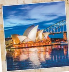
Australia da € 1.300