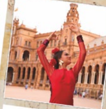
Spagna da € 570