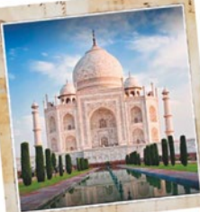
India da € 1.220