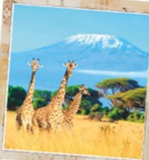
Kenya da € 1.250